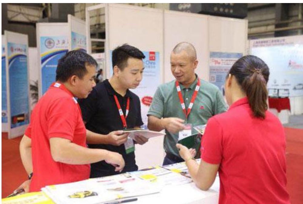
现场来宾在壳牌展台前驻足咨询