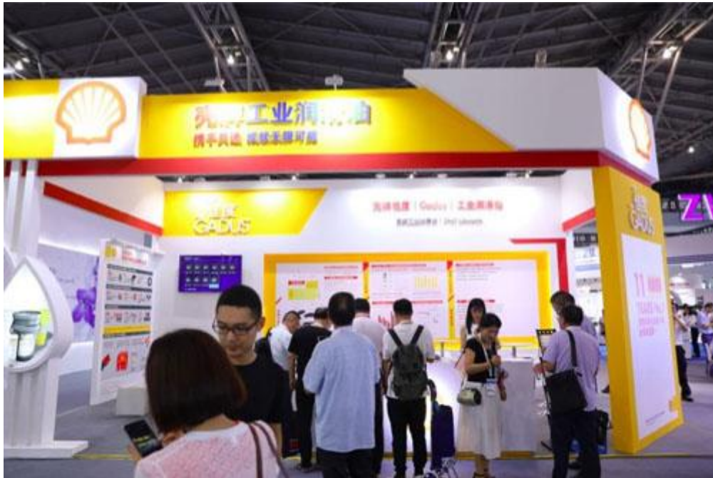
壳牌工业润滑油携领先轴承润滑解决方案亮相 2018 中国国际轴承及专用装备展览会