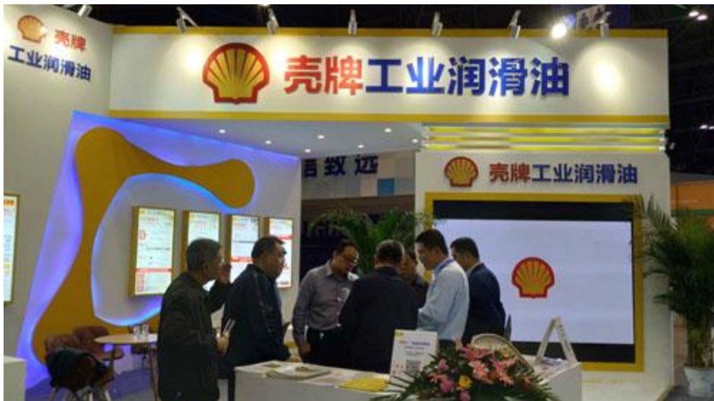
来宾纷纷驻足壳牌能博会展台交流洽谈

展会现场，壳牌还重点展示了工业液压油——壳牌海得力 S1 M。壳牌海得力 S1 M 主要应用于工业液压系统及移动和户外应用，具备可靠的保护性能。它低温性能优异，适用于较宽的工作温度区间，可为大部分工业设备和移动设备提供可靠、高效的保护，同时具备出色的经济实用性。经试验数据证明，壳牌海得力 S1 M 遥遥领先于行业标准。在过滤性能试验中，用时减少 250% 以上。空气释放性能与 ISO11158 标准相比，也提高了 150%【5】。目前，这款液压油已被成功应用于压铸、注塑和工程机械行业，获得了众多客户的青睐。